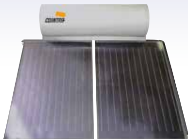
PERSEO 250 F